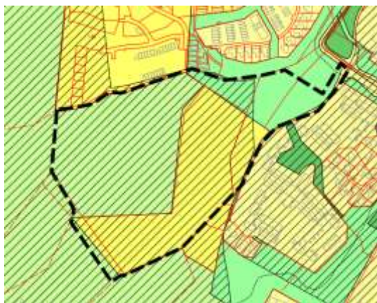
Utsnitt fra kommuneplanens arealdel med planavgrensning

I det innsendte materialet er det oppgitt to ulike planavgrensninger. Situasjonsplanen viser samtidig bebyggelse bare på østlig halvdel av planområdet. Med den videste avgrensninga, kan det hende reglene for planprogram og konsekvensutredning gjelde for dette planarbeidet, jf. Forskrift om konsekvensutredning, § 6 b, vedlegg 1 pkt 25 Nye bolig- og fritidsboligområder som ikke er i samsvar med overordnet plan . Se kartutsnitt under. Tiltak som motfyllinger er ikke kurant i LNFR-område. Planen kan få vesentlige virkninger for miljø og samfunn.