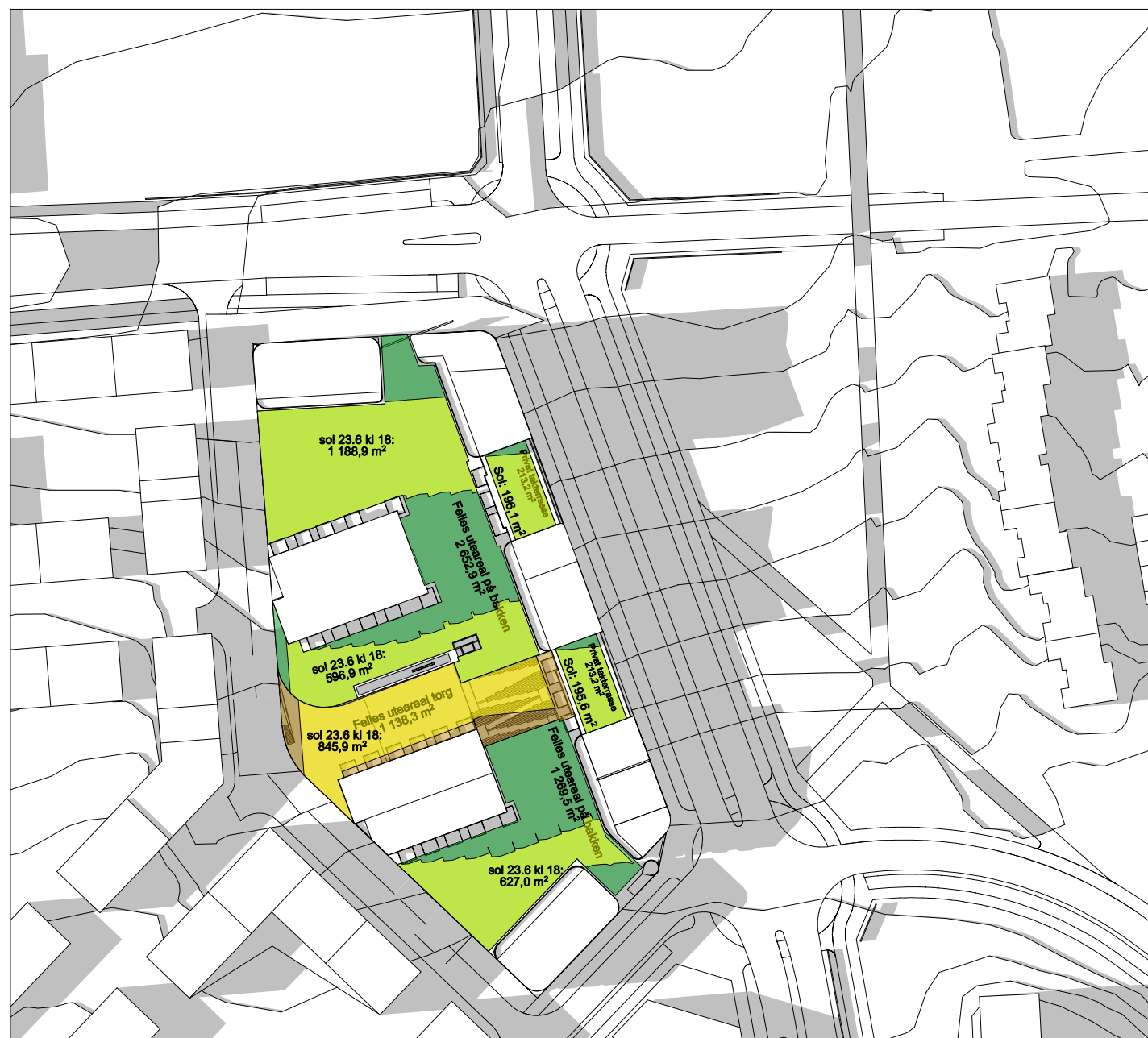
SOL 23.juni kl 18