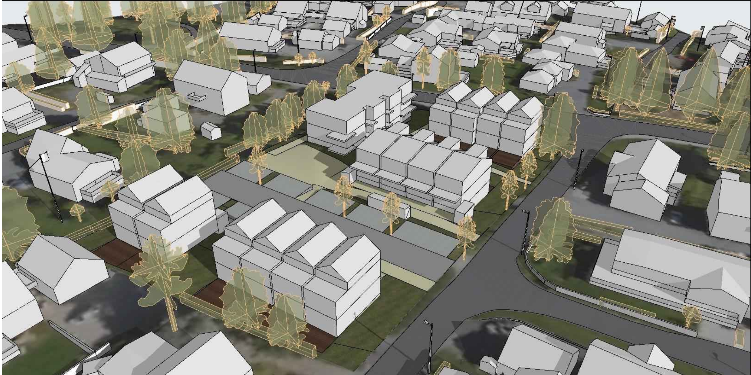
Oversiktsperspektiv fra sørvest