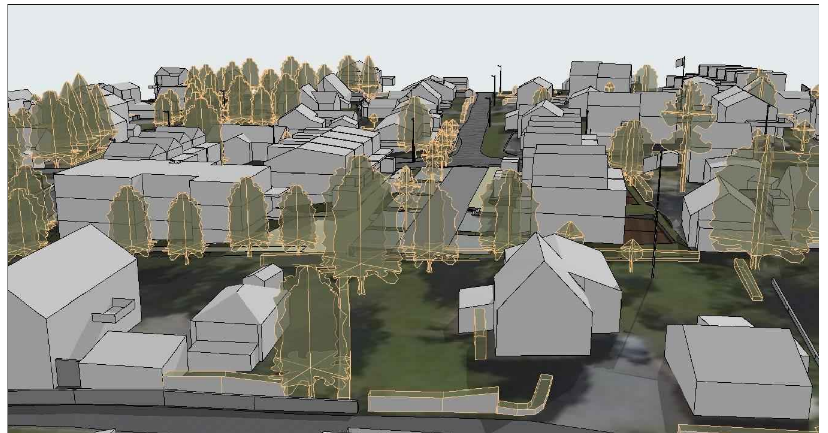
Sett fra nord