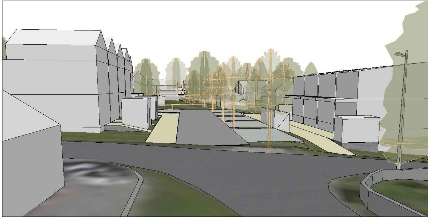
sett fra sør adkomst