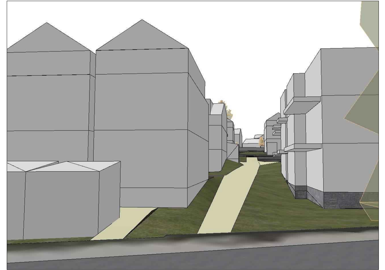
sett fra øst- Søbstadvegen