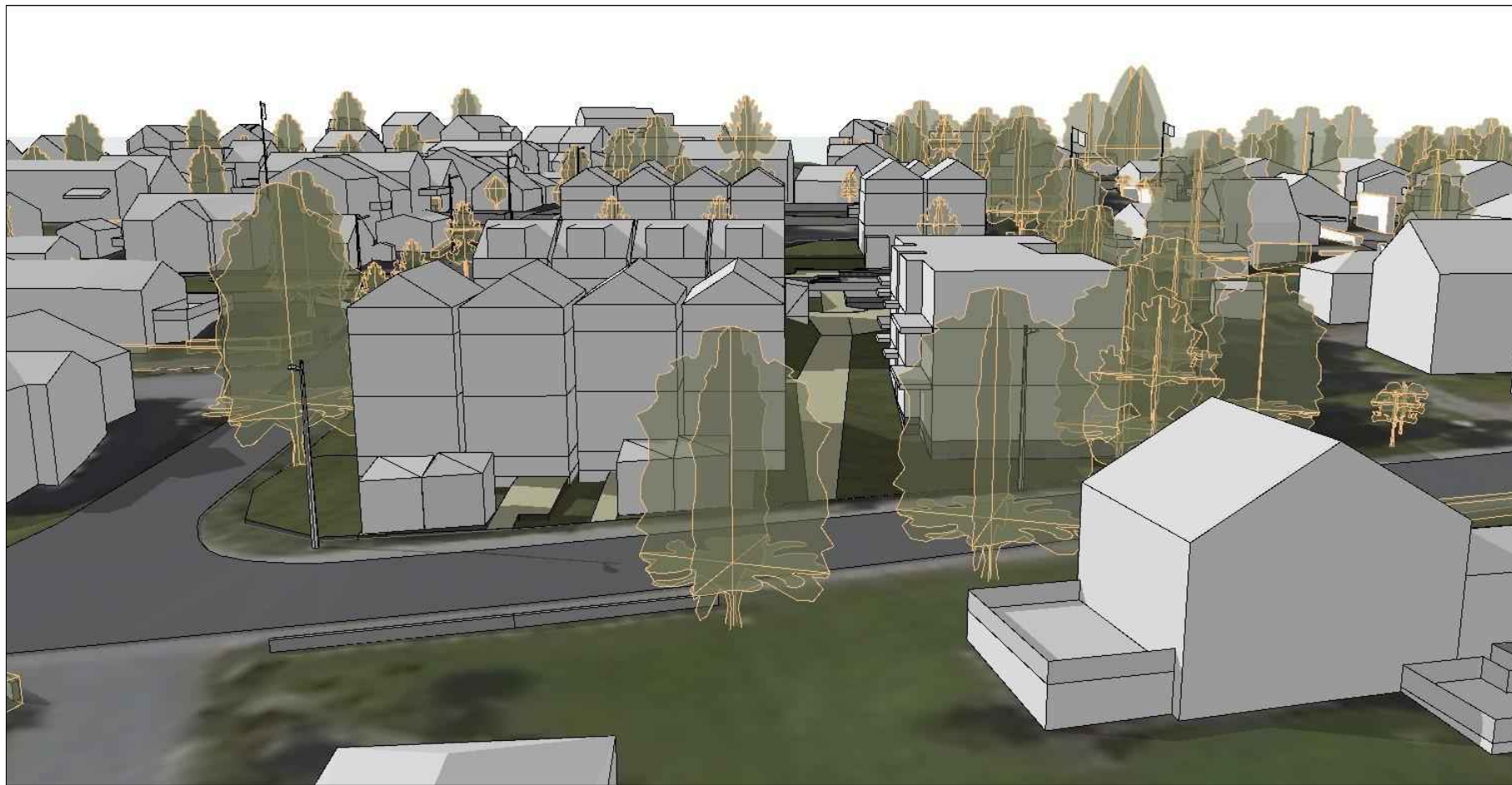
Sett fra øst