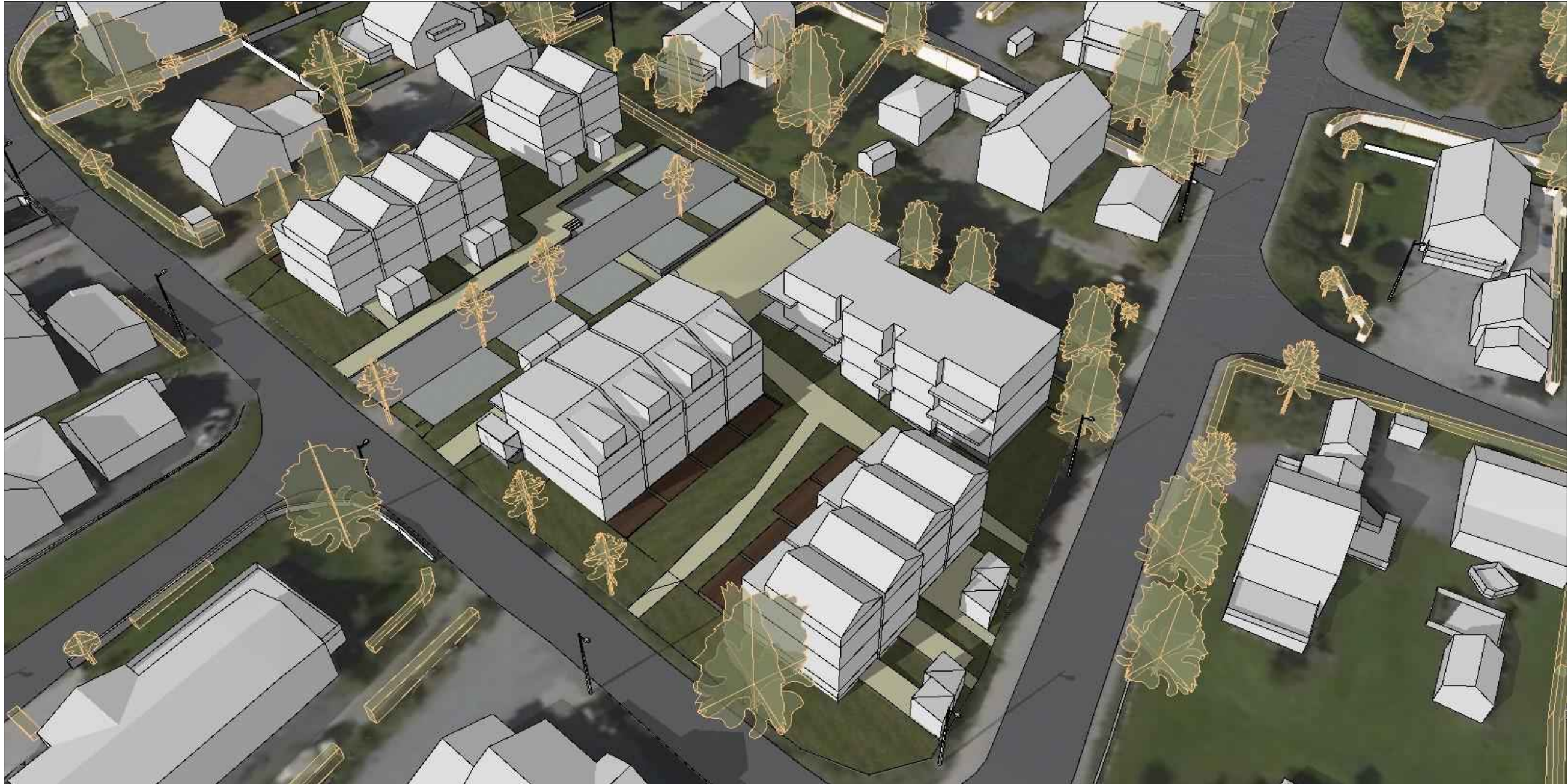
Oversiktsperspektiv fra sørøst