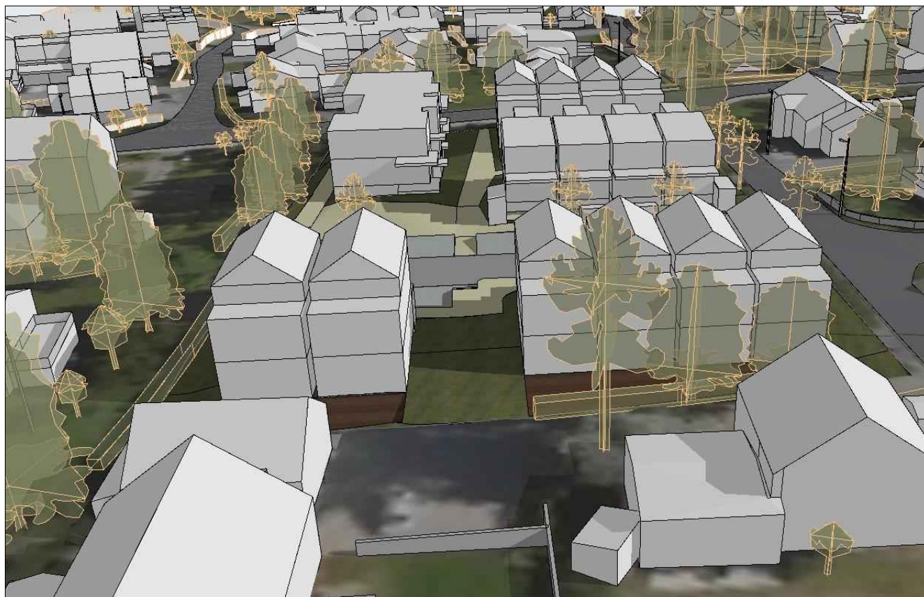
Sett fra vest